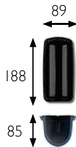
UNIRIS II 50