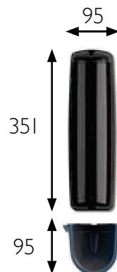
BIRIS II 50